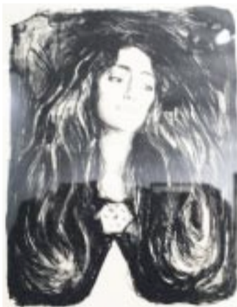
SOROS' FAVORITT. «Brosjen» fra 1903.